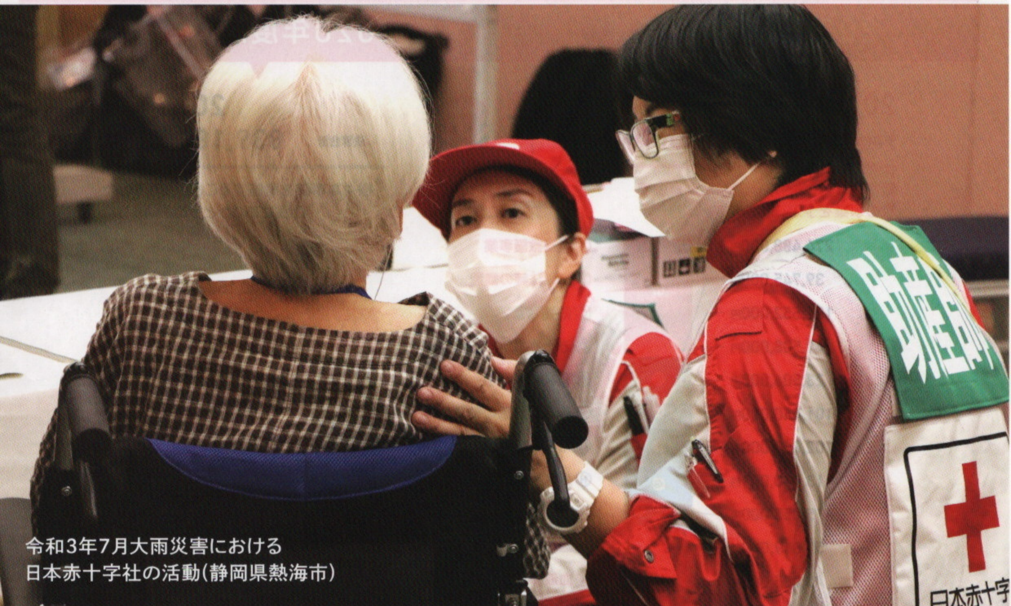
令和3年7月大雨災害における 日本赤十字社の活動(静岡県熱海市)