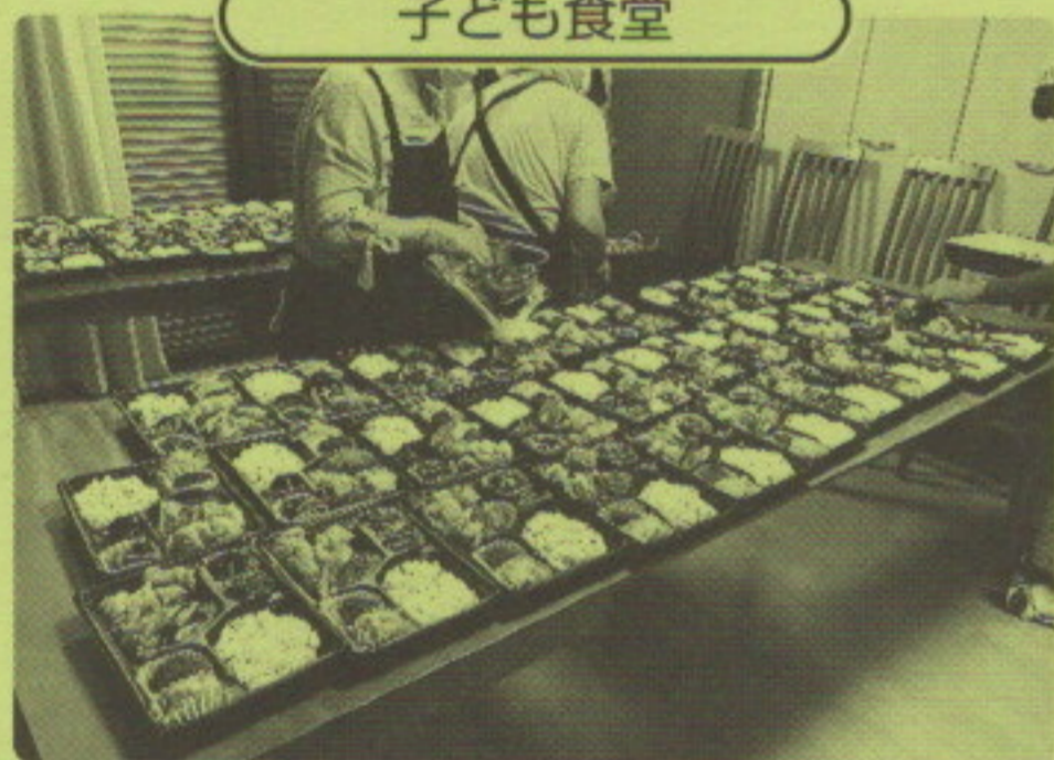
～子どもたちのお弁当づくり～