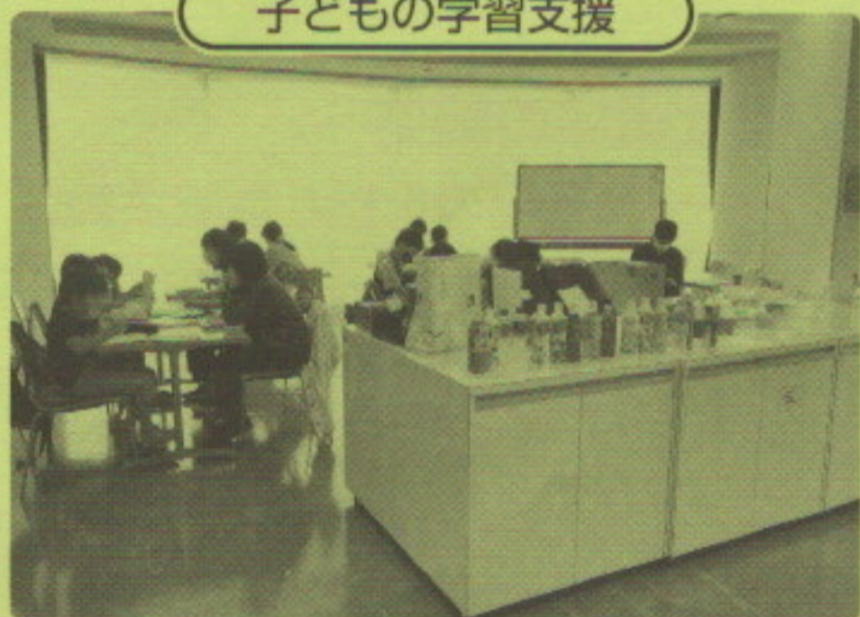
～身近な地域で勉強会～