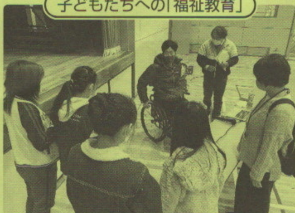
～障がいのある方からの体験談～